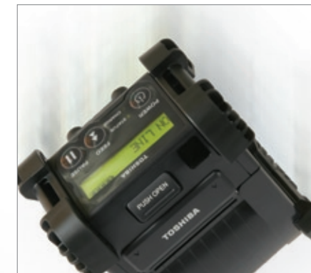
Robusta y resistente, soporta caídas sobre hormigón desde 1,8m (1.5m para B-EP4)