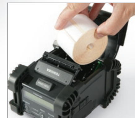
Capacidad de papel líder para evitar cambios de rollo