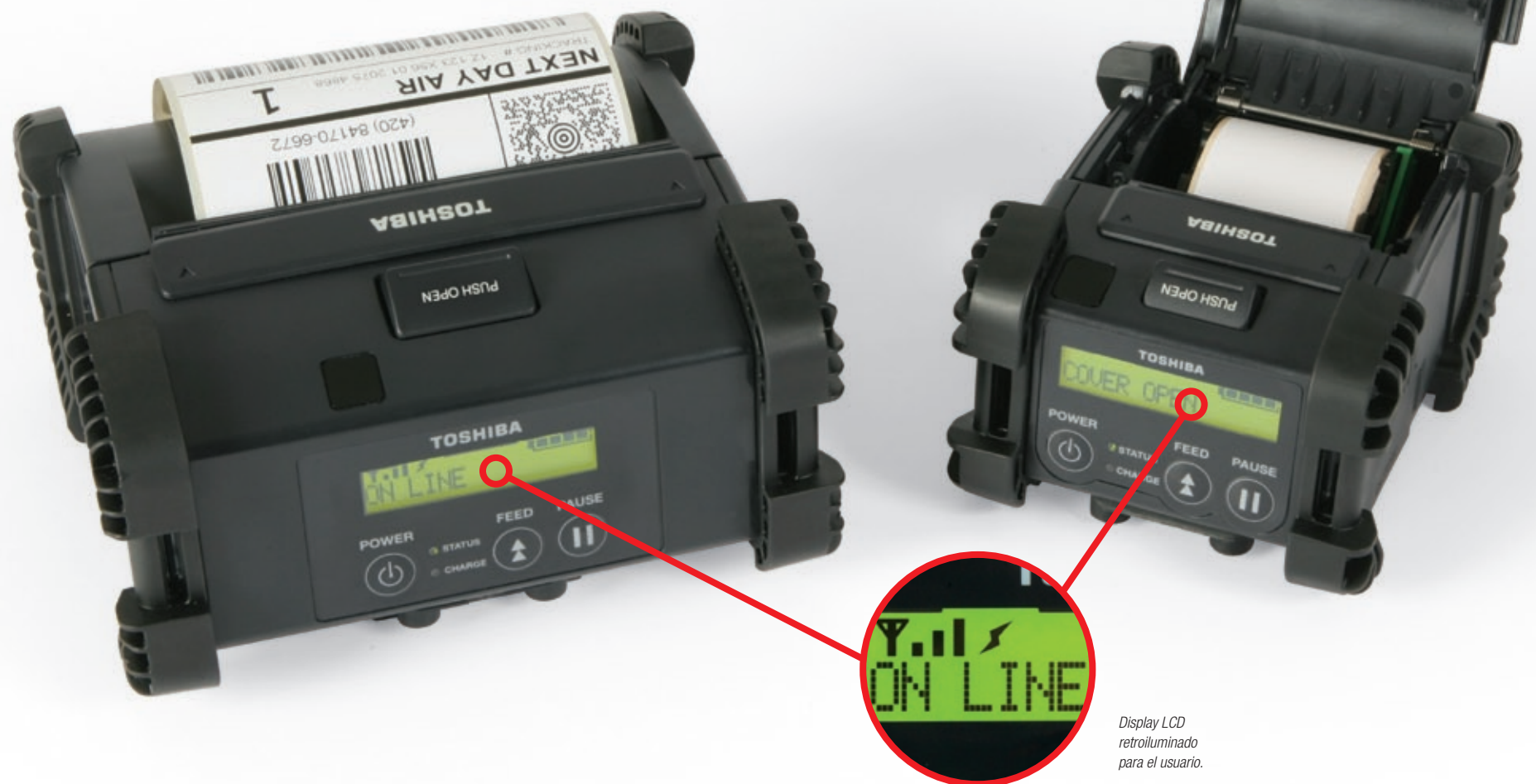
Display LCD retroiluminado para el usuario.