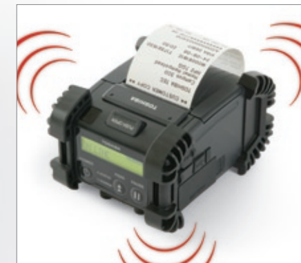
Certificado Wi-Fi (modelo GH40)